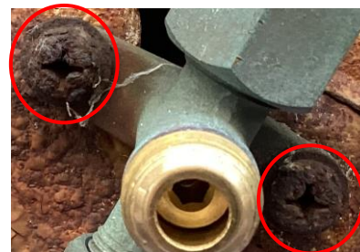
錆びてねじ穴が潰れた例