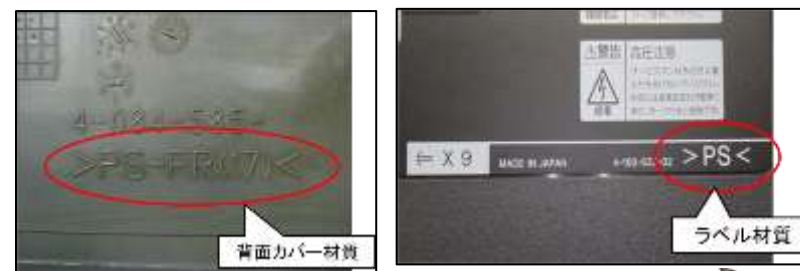
背面カバーと同一の材質を使用したラベルの例（その2）