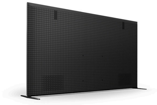
再生材(SORPLAS)を使用したリアカバー