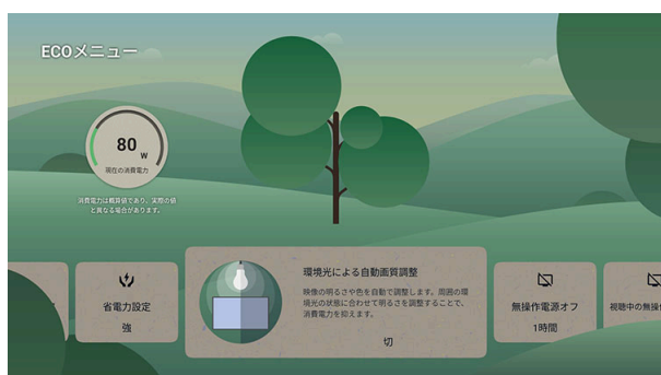
省エネ設定を簡単に一括設定することができる「ECOメニュー」