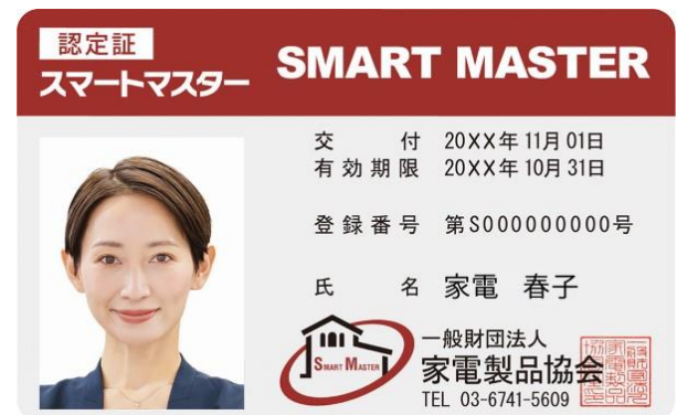
スマートハウスのプロフェッショナル「スマートマスター」認定証

カーボンニュートラル・脱炭素社会への取り組みが加速し、高齢化が進む国内において、省エネルギーや安全意識の高まりからスマートハウスが着目され、住宅、リフォーム関連、エネルギー、家電量販店、通信、教育機関(学生を含む)など幅広い分野の皆様にご受験いただき、直近9月に行われた第47回試験では720名の方が受験され、内347名の方が合格、合格率は48.2%でした。